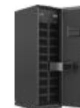
齐心协力, 模块化并联