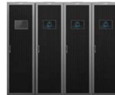
第 3 代: S 3 智能后备锂电系统解决方案

承继核级安全设计理念, 科华迎难而上, 凭借在专业领域深耕 30 多年的经验, 将锂电池应用深度电力电子化, 推出高可靠高安全的第三代锂电解决方案——科华 S 3 智能后备锂电系统解决方案 (Safety-Li、Smart-Li、Simple-Li)。